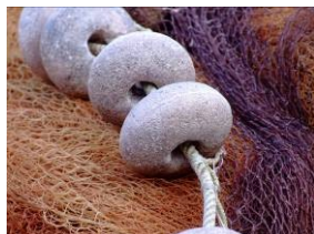
Reti di pescatori