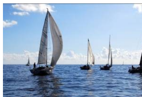
Navigazione in flotta

Se non hai mai provato l'esperienza e sei curioso, se sei scettico e hai sempre pensato che la vela è una cosa da "vip", se sei già un "navigato" della vacanze in barca a vela e avresti proprio voglia di proseguire le ferie estive o se semplicemente ami il mare... vieni con noi e ti daremo l'opportunità di trascorrere due indimenticabili giornate, per scoprire questo straordinario mondo, fatto di riti e linguaggi propri.