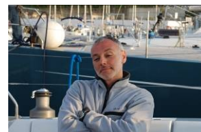
Avvicinamento alla vela 2009

Se non hai mai provato l'esperienza e sei curioso, se sei scettico e hai sempre pensato che la vela è una cosa da "vip", se sei già un "navigato" della vacanze in barca a vela e avresti proprio voglia di proseguire le ferie estive o se semplicemente ami il mare... vieni con noi e ti daremo l'opportunità di trascorrere due indimenticabili giornate, per scoprire questo straordinario mondo, fatto di riti e linguaggi propri.