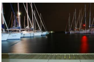
Marina di Procida

E' compreso: Polizza corpo, assicurazione RC, GPS, log, eco, wind, VHF, radio stereo, CD, carte nautiche, portolano, pagine azzurre, bimini top, cappottina paraspruzzi, tavolo esterno, tender, salpancora, Genoa awolgibile (su tutti i modelli), randa awolgibile (vedi tabella), bombole gas, acqua calda, coperte, cuscini, doccia interna ed esterna, frigo, attrezzatura cucina completa, caricabatteria, cavo e presa 220v. Non è compreso: Carburante barca e fuoribordo, acqua, cambusa e ormeggio in altri porti, pulizia finale allo sbarco, lenzuola.