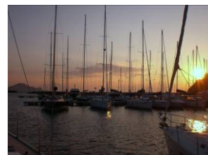
Marina di Procida

In un fine settimana possiamo navigare in luoghi molto belli senza la necessità di fare lunghi trasferimenti, e di godere appieno le bellezze naturali delle nostre isole Ischia, Capri, e della costa.