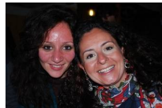
Avvicinamento alla vela 2009